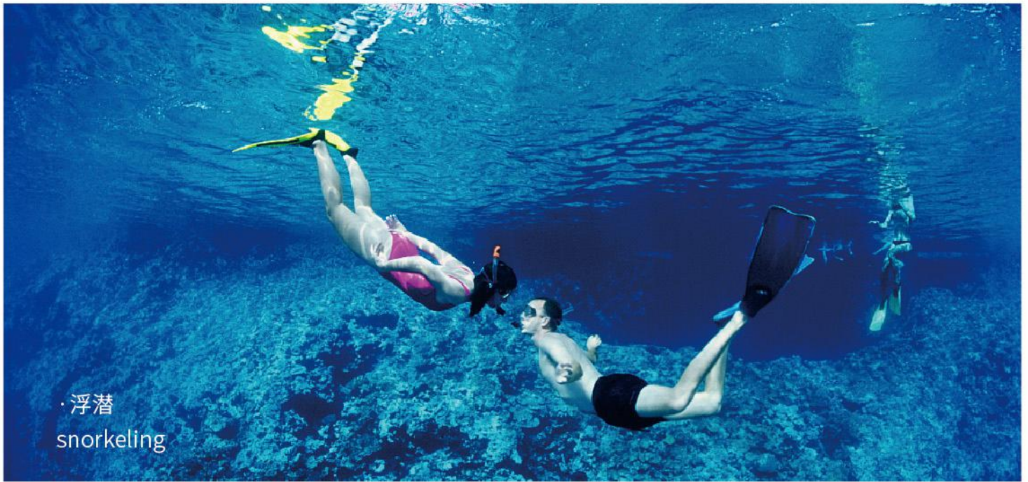
· 浮潜 snorkeling