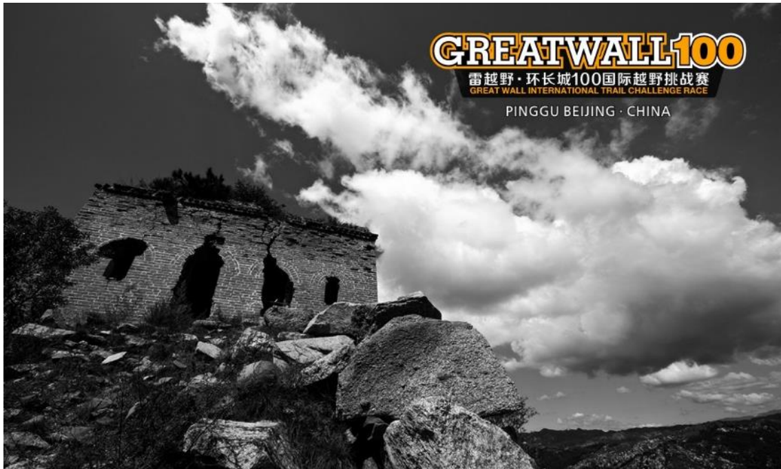
▲镇罗营的古长城“敌台”遗址