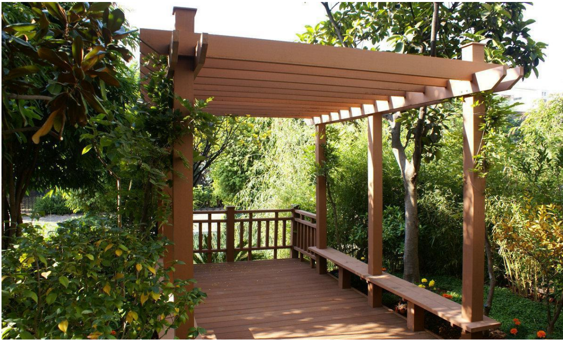
▲清水湖-关上村木栈道

全程项目和 50 公里项目右转继续前行约 100 米后，左转下台阶，去往关上村的木栈道入口，沿着木栈道跑约 1.1 公里，到达关上村东入口。