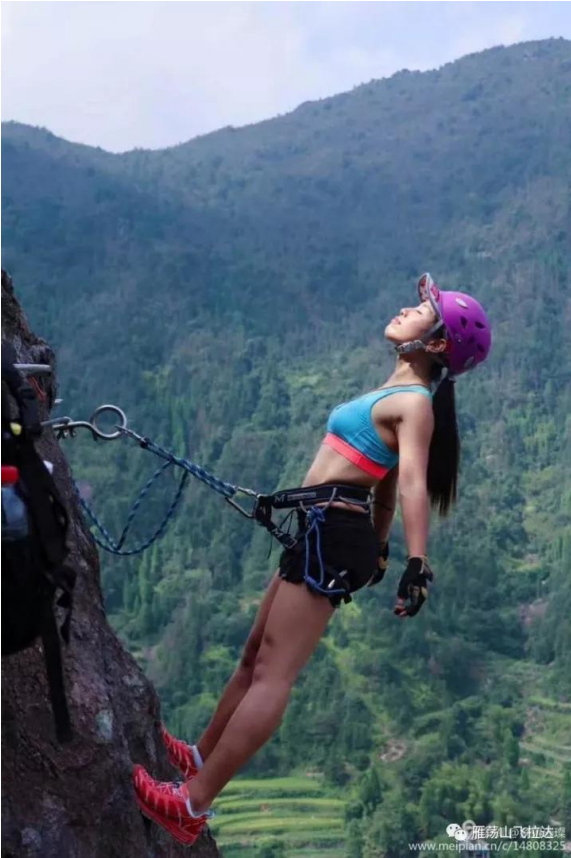
D2: 龙西白岩山脊穿越