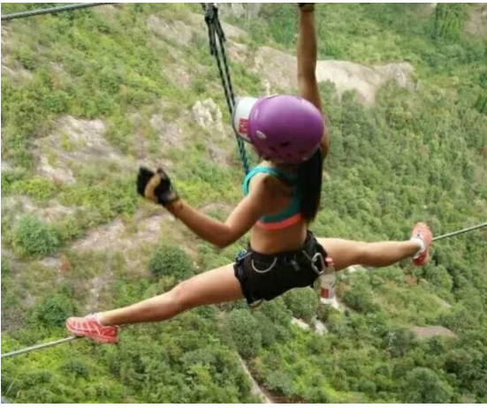
很多事尝试了才知道自己潜力多大!