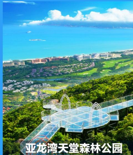
亚龙湾天堂森林公园